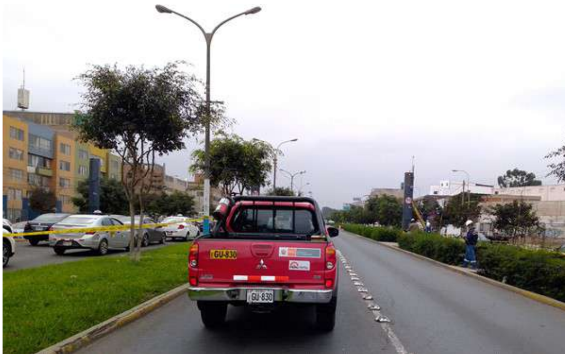
ILUSTRACIÓN DEL MEDIDOR DE VELOCIDAD FIJO CON NÚMERO DE SERIE 1925; 1926