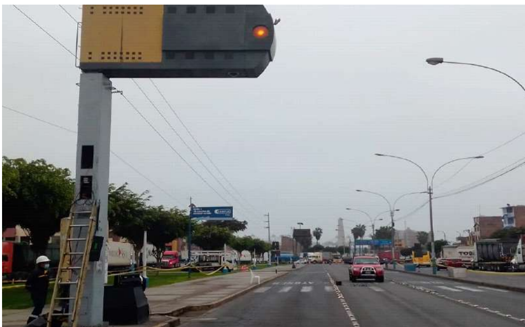
ILUSTRACIÓN DEL MEDIDOR DE VELOCIDAD FIJO CON NÚMERO DE SERIE 516