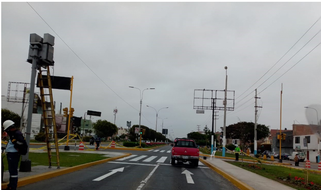
ILUSTRACIÓN DEL MEDIDOR DE VELOCIDAD FIJO CON NÚMERO DE SERIE 523